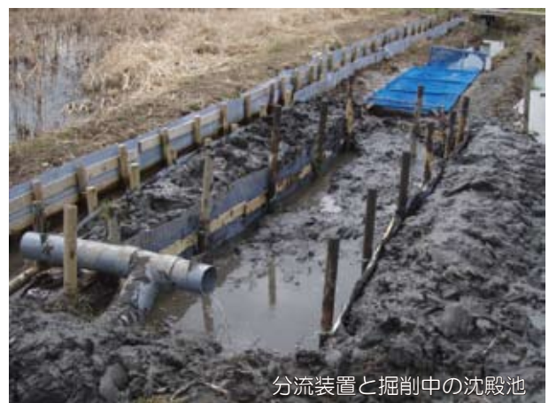
分流装置と掘削中の沈殿池