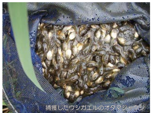
捕獲したウシガエルのオタマジャクシ