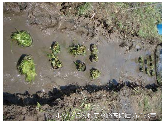
ポットに入れて水路底に置いた水草