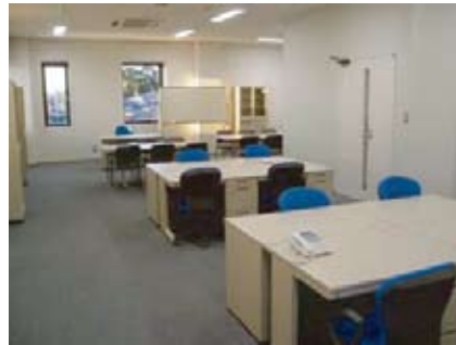
かしわ環境ステーション事務室